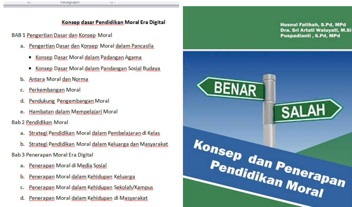
Gambar 2. Desain Produk: Materi dan Cover

Desain produk merupakan tahapan yang penting dalam penelitian pengembangan (Sugiyono, 2014). Pada tahapan ini tim peneliti dan pembahas telah mengumpulkan berbagai literatur untuk membahas materi yang terdapat dalam buku. Setelah mendapatkan berbagai literatur tim peneliti membahas materi dan melengkapi pembahasan dengan menggunakan literatur yang ada; tim peneliti juga menentukan gambar-gambar yang akan melengkapi penjelasan materi tersebut. Selain itu tim peneliti juga menyebarkan angket kepada para guru dan dosen untuk mendapatkan informasi terkait penerapan pendidikan moral. Rancangan materi buku dan desain cover dapat dilihat pada Gambar 2.